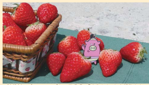
■読谷村のパワーアップキャラクター「よみとん」も大好物かも!?

さらに将来的には、イチゴの果実の出荷だけではなく「栽培方法」の普及も検討しています。苗の育て方から設備の管理方法まで、栽培に必要な情報をすべてマニュアル化して、ソフト面・ハード面をパッケージにして販売することを目指しています。「沖縄でのイチゴの栽培は本当に難しい(笑)。でもだからこそ、初めて参入する人でもリスクを最小限に抑えてス