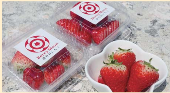
■ブランド名は「Berry Moon(ベリームーン)」。読谷村のゆんた市場で販売中

栽培品種も厳選し、暑さに強い夏秋イチゴ「信大BS819」を導入しました。甘酸っぱい味わいが特色で、甘さの指標となる糖度は平均10.6度とされていますが、実際に収穫した果実では12、13度の糖度が得られており、数字の上では他のブランドイチゴに匹敵する甘さを示しています。また外皮がやや固めの食感は、「傷つきにくい」という点で輸送面のメリットにもつながっています。