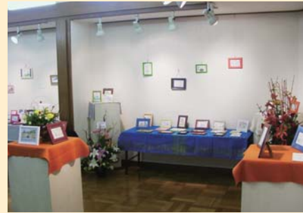
■2008年に初めて開いた個展の一場面。会場となった千葉市稲毛のギャラリーの観客動員数新記録を樹立しました

「体験料100円。感謝の気持ちを絵と言葉で素直に表現できるし、ちょうどいいかも」。真剣に絵と向き合うという経験はおそらく高校の美術の授業以来でしたが、思いもよらず絵筆が進むこと進むこと。わずか10分程度の間「完璧!」と納得のいく作品が完成し、「あれ、ひよっとして私って天才じゃないかしら(笑)」と隠れていた絵心を発見しました。以来、静養中の毎日の暮らしの中で見たものや気付いたことを、は