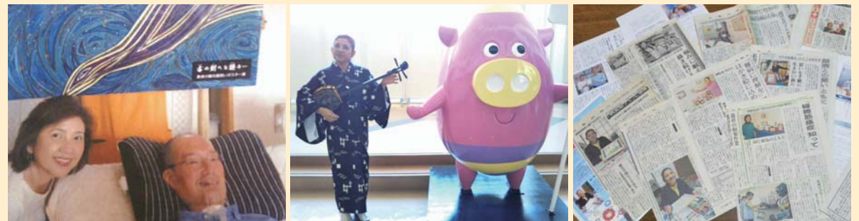
■右:1回目の個展の新聞取材をはじめ、メディアに取り上げられること多数 中:2015年帰沖後は三線教室に通い、新人賞を受賞。手話の習得にも励み、嘉手納・読谷のボランティア通訳士に登録 左:筋委縮性側索硬化症(ALS)患者の友人、現・参議院議員の船後靖彦氏と。数多くの作画依頼を受け、さまざまな絵画を贈呈しました